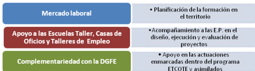
Fig. 2 Ejes de intervención de la UPD

La UPD se estructura en cuatro áreas de intervención (fig. 1), centrándose en tres los ejes de actuación que se refieren, por un lado, a las acciones sobre el mercado laboral , el acompañamiento a las escuelas taller, casas de oficios y talleres de empleo , y por último, la complementariedad con la Dirección General de Formación para el Empleo (fig.2).